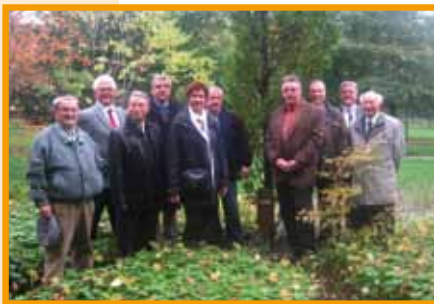
Gemeinsamer Besuch der Säuleneiche im Thie-Park

Am Sonntagvormittag gab es eine Experten-Führung zum Halberstädter Domschatz, dem ein mittägliches Fischessen am Kloster Michaelstein folgte. Zum Abschluss ging es zum Herbstbiwak des Versorgungs- und Instandsetzungszentrums Sanitätsmaterial Blankenburg am Regenstein. Hier fand noch ein Festakt zum Tag der Deutschen Einheit mit weit über eintausend Bürgern und Soldaten statt. Wir freuen uns, dass die Blankenburger Parteifreunde im Januar nach Herdecke zum Grünkohlessen kommen wollen.