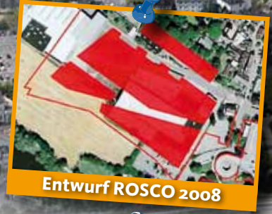
Entwurf ROSCO 2008