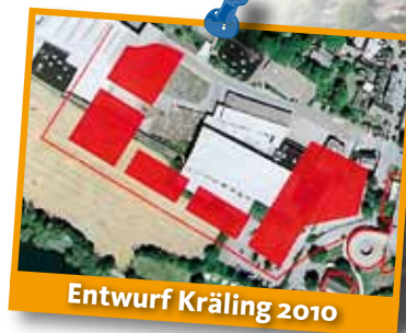
Entwurf Kräling 2010

Der im Jahre 2006 mit den Stimmen von CDU, SPD und FDP verabschiedete Masterplan sah eine kompakte Bebauung mit bis zu 13.000 m 2 Verkaufsfläche vor. Das jetzt vom Investor Kräling vorgelegte Konzept geht von einer wesentlich offeneren Bebauung aus. Dies wird erreicht, weil sich das Angebot auf mehrere Einzelgebäude verteilt. Ein ganz entscheidender Unter-