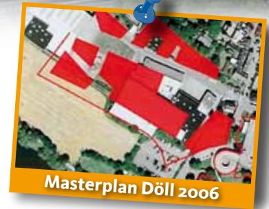
Masterplan Döll 2006

schied zur Planung des Jahres 2006 ist die annähernde Halbierung der Verkaufsfläche auf heute ca. 7.700 m 2 .