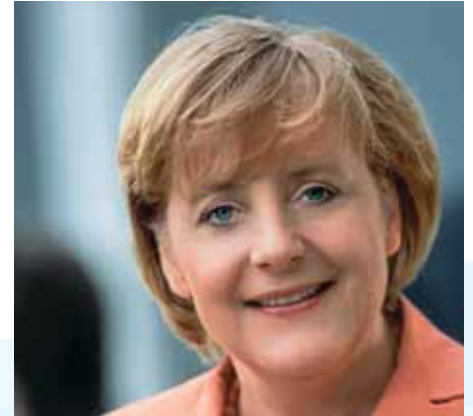
Dr. Angela Merkel MdB

Zusammen mit Ihnen, den Bürgerinnen und Bürgern, wollen die CDU und ich persönlich nach dem 18. September dazu beitragen, dass Deutschland seine Chancen besser nutzt. Ich bitte Sie um Ihre Unterstützung!