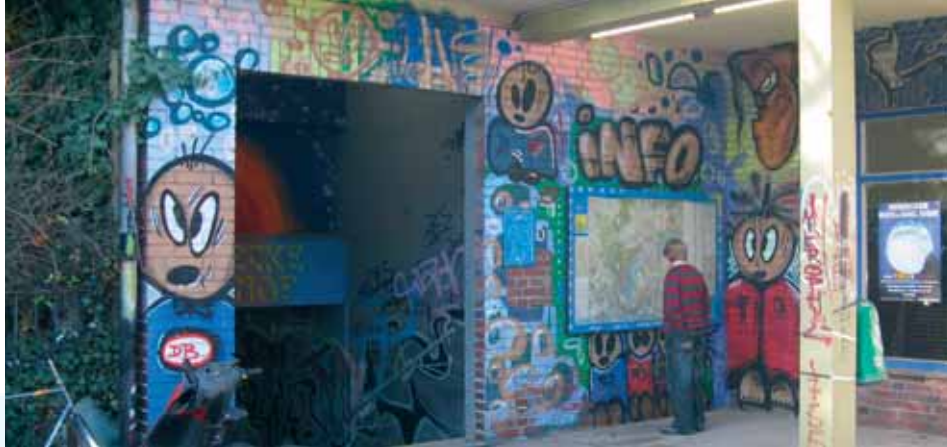
In diesem Jahr wurde bereits das verschmierte Bahnhofsgebäude abgerissen. Nach dem Bau der neuen Bahnsteigzugänge in den Sommerferien soll der schmutzige Tunnel zum Bahnsteig baulich verschlossen werden.

CDU stimmt schienengleichen Bahnsteigzugängen zu