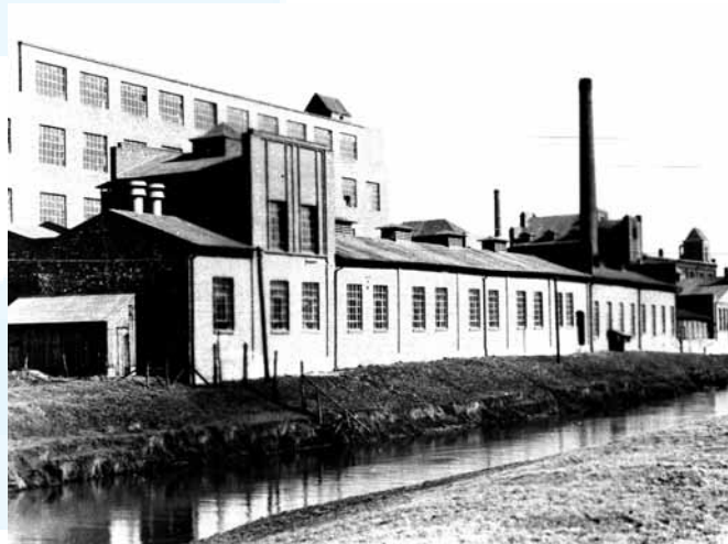
Alte Stoffdruckerei Habig mit Mühlengraben.

des Neuen Stadtquartiers ist aus Sicht der CDU-Herdecke u.a. größte Beachtung zu schenken, wobei der "alte Innenstadtkern" so mit dem "Neuen Stadtquartier" zu verbinden ist, dass keine "Trennung" entsteht. Hierbei gilt es die Ergebnisse des Einzelhandesgutachtens für Herdecke zu beachten. Das Gutachten kommt zu dem Ergebnis, dass wesentlich mehr als ein Drittel der in Herdecke vorhandenen Kaufkraft in den benachbarten Städten ausgegeben wird; somit fließt erhebliche Kaufkraft aus Herdecke ab. Um mehr Kaufkraft in Herdecke zu binden, gilt es, das bereits vorhandene Warenangebot sinnvoll und verträglich im Neuen Stadtquartier zu entwickeln. Insbesondere ist an eine Erweiterung bisher nicht zu realisierender Angebote zu denken (z.B. ein Magnet, der eine Mindestgröße haben muß). Das Einzelhandelsangebot im