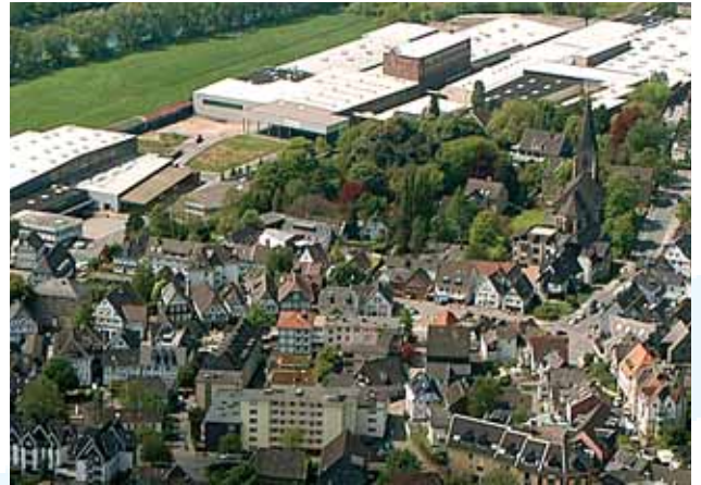
Westfalia-Gelände von Osten her gesehen