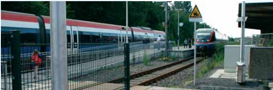
So ähnlich wie auf diesem Bild wird es auch in Herdecke bald aussehen. Einfahrt des linken Zuges während der ausfahrende Zug im Bild rechts steht! „Linksverkehr“ im Bf Lüdinghausen wegen der Lage des Bahnsteig-Zugangs. Man beachte auch das Kind links im Bild, das gerade das Gleis gequert hat.

Da am Herdecker Bahnhof nur weniger als 400 Fahrgäste täglich ein- und aussteigen und die Züge auch in Zukunft nur einmal stündlich abfahren werden, sind keine aufwändigen Absperrungen oder Schranken notwendig. Der Zugang über die Gleise erfolgt ca. 20 m vor dem