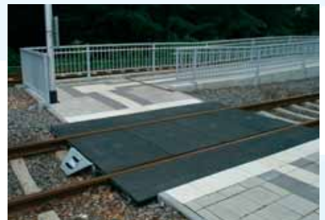
Ähnlich wie hier am Bahnhof Havixbeck sollen auch in Herdecke die Zugänge zum Bahnsteig ebenerdig über die Gleise geführt werden.